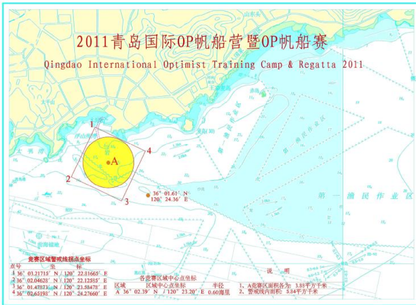
附录 2: 青岛浮山湾海域图